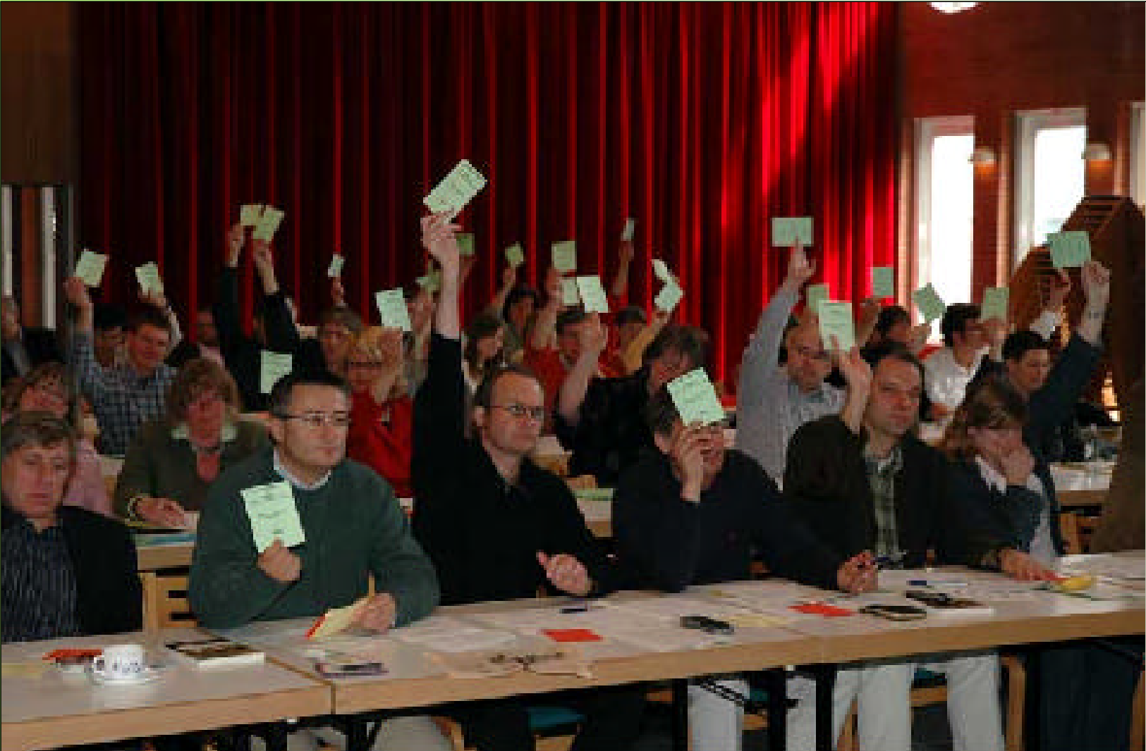
Congrès statutaire du 28 janvier 2006 à Esch-sur-Alzette